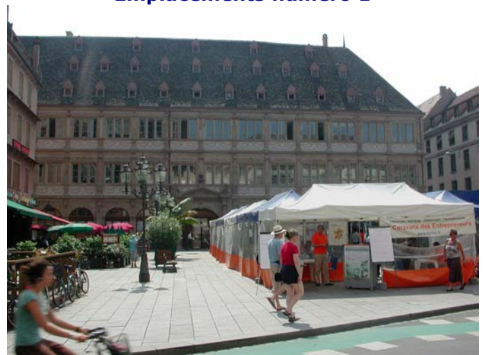
La Caravane des Entrepreneurs à Strasbourg, Place Gutenberg, le 14/06/2006